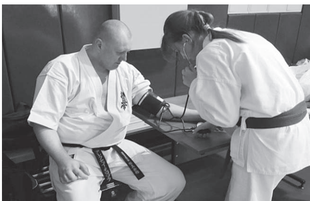
Рисунок 4 – Медицинский контроль на тренировке

2. Britvina, V.V. Gymnastic exercises with a force component for people engaged in extreme activities that have suffered myocardial infarction / V.V. Britvina // Theory and Practice of Applied and Extreme Sports. – 2012. – No. 1(23). – P. 50-52.