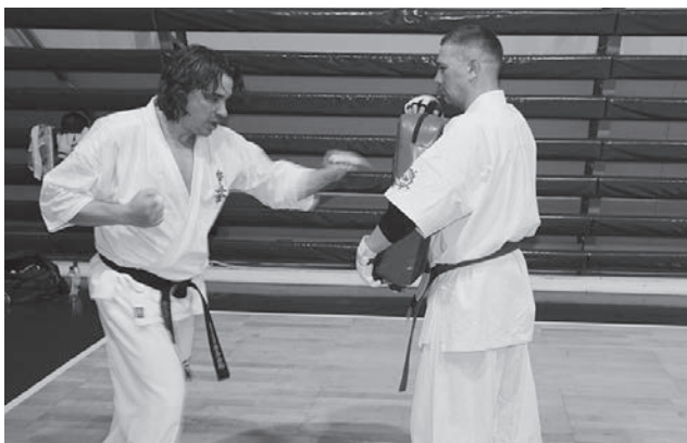
Рисунок 3 – Тренировочное занятие по каратэ

1. Baikovsky, Yu.V. Factors determining the extremity of sports activity / Yu.V. Baikovsky // Extreme activity of man. – 2016. – No. 2(39). – P. 55-59.