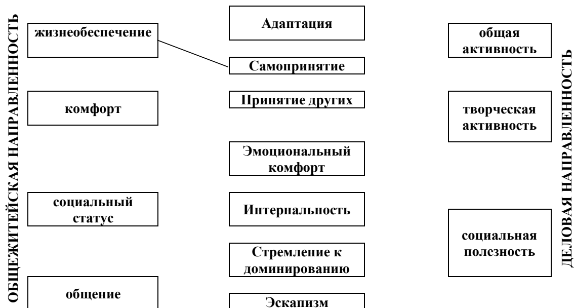
Рис. 4. Достоверные корреляционные связи показателей социально-психологической адаптации с мотивационными индикаторами общежитейской и деловой направленности личности у девочек 12-15 лет специализации футбол Примечание: - - - - отрицательные связи; — — — — положительные связи.