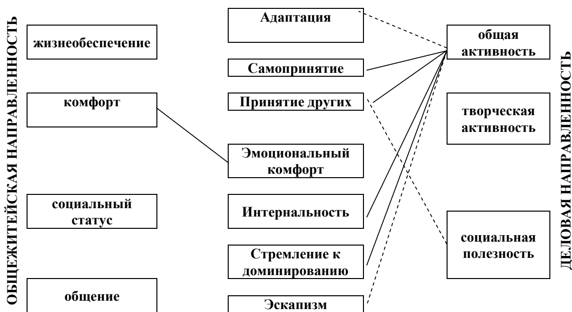
Рис. 5. Достоверные корреляционные связи показателей социально-психологической адаптации с мотивационными индикаторами общежитейской и деловой направленности личности у мальчиков 12-15 лет, не занимающихся спортом

направленности личности и показателями социальной адаптации (рис. 2-4).