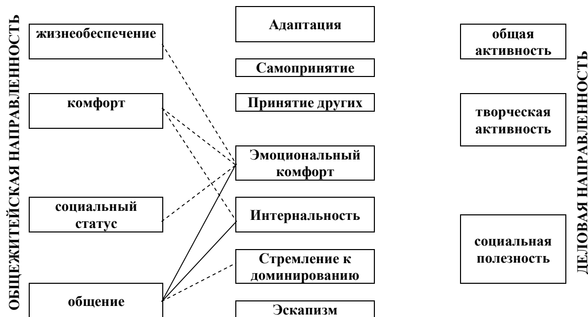
Рис. 7. Достоверные корреляционные связи показателей социально-психологической адаптации с мотивационными индикаторами общежитейской и деловой направленности личности у мальчиков 12-15 лет специализации футбол Примечание: - - - - отрицательные связи; — — — — положительные связи.

Характер устанавливаемых взаимосвязей у девочек 12-15 лет специализации футбол позволяет заключить, что чем больше у девочек выражено стремление удовлетворить свои житейские потребности, тем более принимают себя, тем выше их готовность учиться у других (рис. 4).