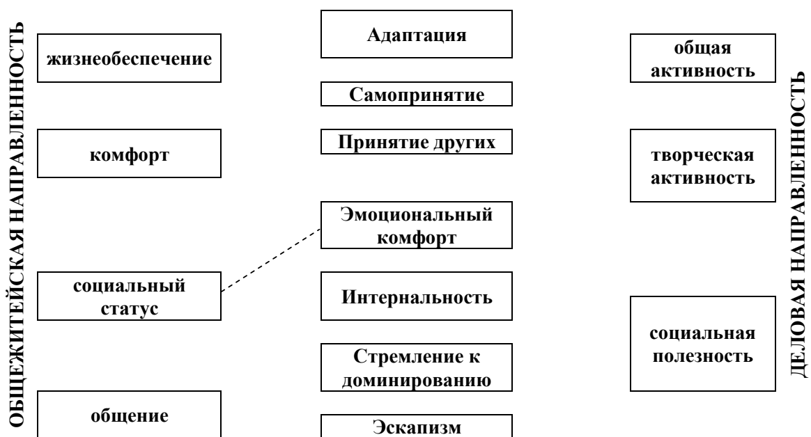
Рис. 3. Достоверные корреляционные связи показателей социально-психологической адаптации с мотивационными индикаторами общежитейской и деловой направленности личности у девочек 12-15 лет специализации гандбол

Анализ корреляционной матрицы в группе девочек 12-15 лет, не занимающихся спортом, показал многочисленное количество значимых как положительных, так и отрицательных связей между компонентами общежитейской и деловой направленности личности и показателями социальной адаптации, за исключением компонента «социальный статус», который у них не был выявлен (рис. 1). Характер устанавливаемых взаимосвязей позволяет заключить, что девочки испытывают