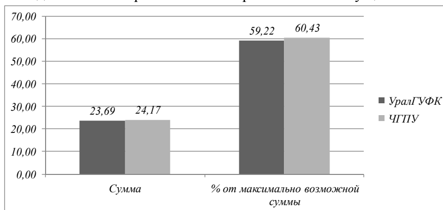
Рисунок 1 – Гистограмма результатов тестирования уровня студентов УралГУФК и ЧГПУ к спортивно-педагогическому менеджменту

Результаты тестирования представлены на рисунке 1. Результаты, показанные в каждом учебном заведении, действительно различаются несущественно.