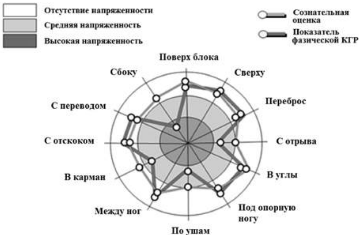
Рис. 2. Психологический профиль сознательной оценки выполнения броска гандболисткой и показателя физической составляющей при воздействии семантическими раздражителями шаблона "Броски в гандболе"

ляющей, которые отражались на индикаторе аппаратно-программного устройства ИПЭР-1К.