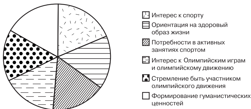
Рис. 2. Направления педагогической деятельности в рамках олимпийского движения

Важная задача педагогической деятельности в рамках олимпийского движения состоит также в формировании и совершенствовании у молодежи целого комплекса гуманистически ориентированных умений, навыков, способностей: